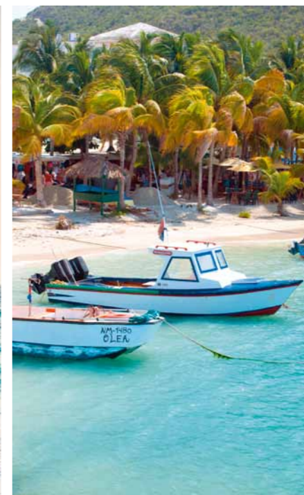
St. Maarten is ideaal gelegen als u wilt eilandhoppen in de Caribbean.