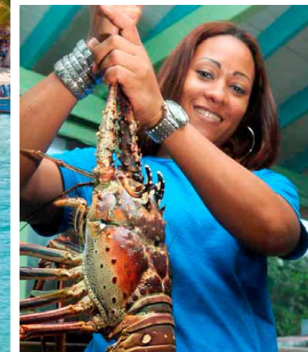
Voor het Fête de la Cuisine wordt het beste van het beste uit de zee gevestigd.